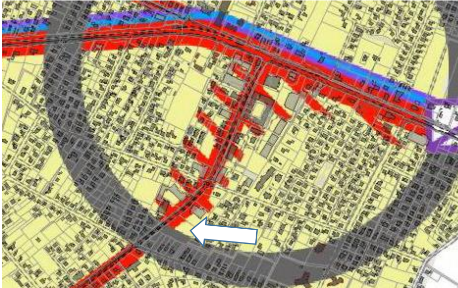
Abb. 1 Das Zentrale Siedlungsgebiet (gelbe Fläche) gemäß der Zeichnerischen Darstellung des RROP des Landkreis Aurich, mit markiertem Vorhabenstandorten (Pfeil)